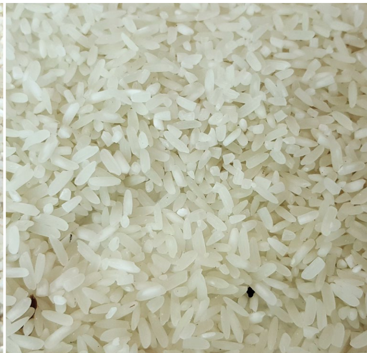
Mbolea za Yara