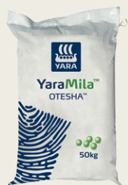
Kilo 50 kwa ekari