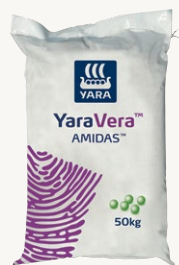
Kilo 50 kwa ekari