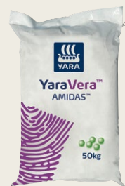
Kilo 50 kwa ekari