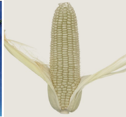
Programu ya Mkulima