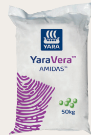
Kilo 50 kwa ekari

Unahitaji mahindi yenye ubora? Tumia mbolea zetu