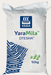
Kilo 50 kwa ekari