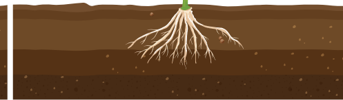
Kabla ya mbelewele