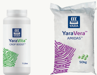
Lita 1 kwa ekari